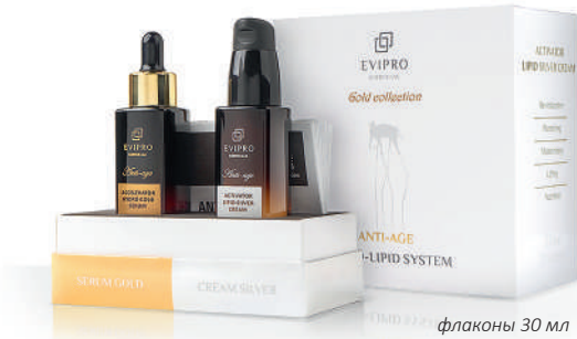
флаконы 30 мл

Двухкомпонентная система ОМОЛОЖЕНИЯ. Не имеет аналогов! Слияние двух сбалансированных элементов системы (крем и сыворотка) обеспечивает эффективную действующую концентрацию ценных омолаживающих компонентов формулы, максимально раскрывая их потенциал и усиливая биодоступность: