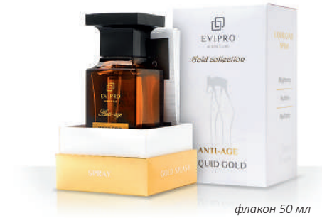
флакон 50 мл

Биоревитализирующий спрей с армирующим жидким золотом и биоактивным пептидным комплексом, препятствующим формированию морщин. Содержит эффективный набор увлажняющих факторов в соотнесении со SMART частицами серебра.